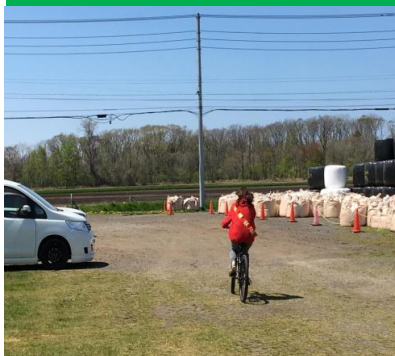
第四走者は地区代表です！