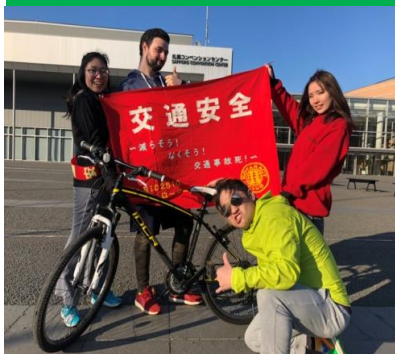
無事到着しました！