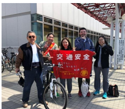
出発前に集合写真

出発地点から中継地点である恵庭市・むらかみ牧場まで、川本地区RA副委員長が応援に駆けつけていただき、走者は向かい風に負けることなく、目的地に向かって走り出しました。