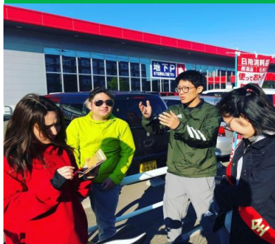
最終走者は地区代表ノミニー