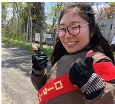
第三走者に交代です