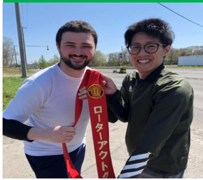
第六走者にたすきを渡します