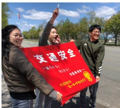
ドライバーに呼びかけ

また、たすきを繋いで目的地に向かうことを通して、会員同士の絆がより深まる機会となりました。