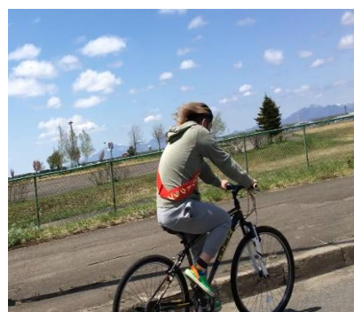
向かい風で中々進みません