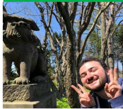
中間地点の神社にて