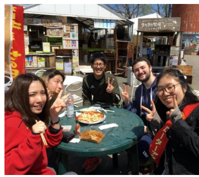
むらかみ牧場にてお昼休憩