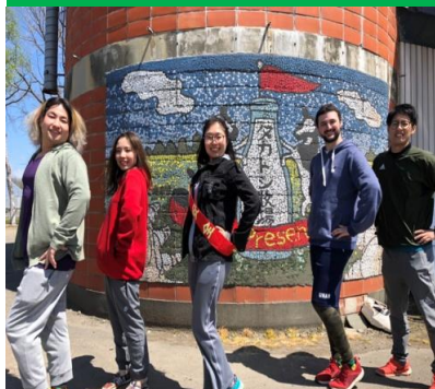
Miss.交通安全PRのポーズ