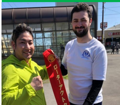
コーエン会員にバトンタッチ