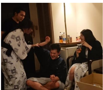
城地会員に絡む地区代表