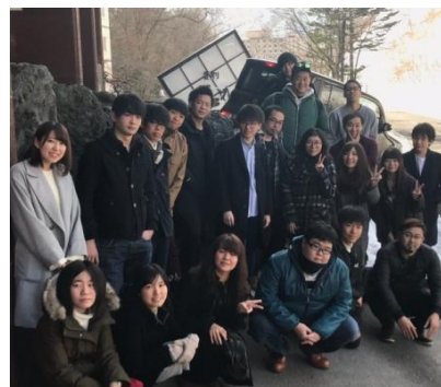
最後は動画も撮りました