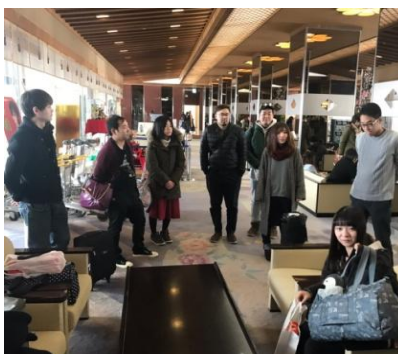
家に着くまでがアクトです！