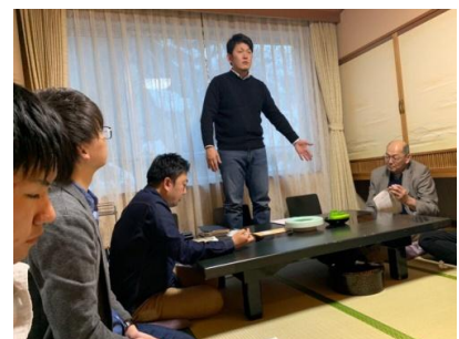
川下地区RA委員長のご講評