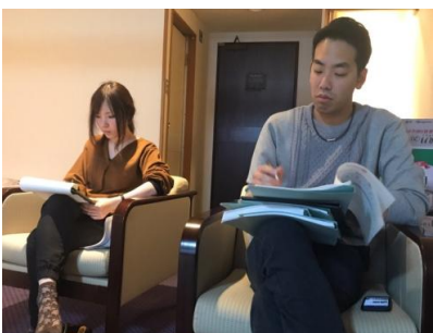
地区代表と地区幹事の進行