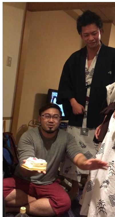
青野会員の誕生日でした★