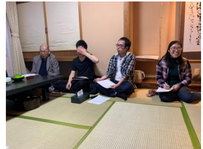
千歳RACの意見を伺います