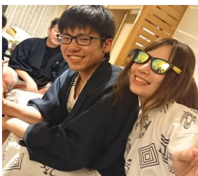
室蘭北RACとも親睦を深めます