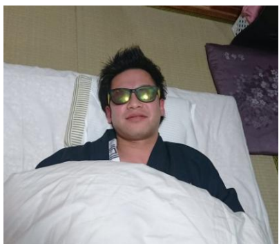
就寝時間は朝の4時…