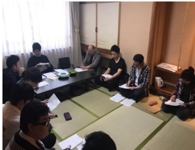
半年間の行事報告中です