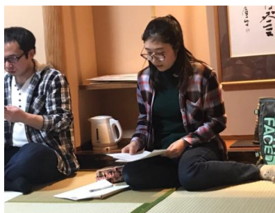
次年度の体制が固まりました