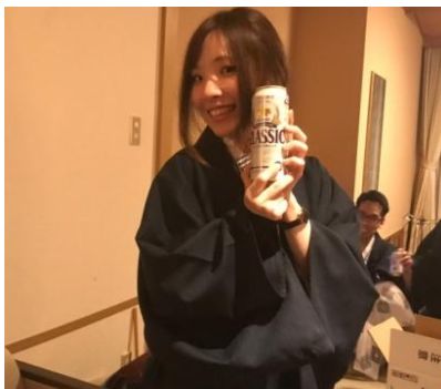
食事後は大部屋で懇親会♪