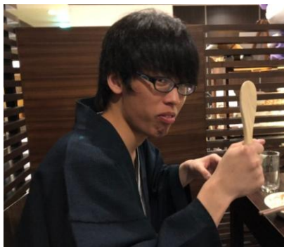
まずは腹ごしらえ！

今回は23名という多数の参加人数であったことから、今後の地区行事も積極的に参加を呼びかけていきたいと思えます。