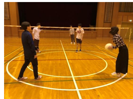
体育館でのミニバレーの様子