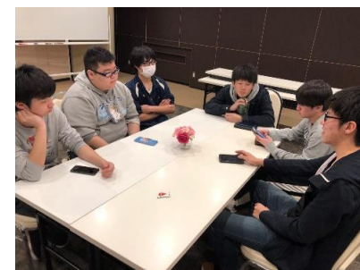
第二例会の話し合い