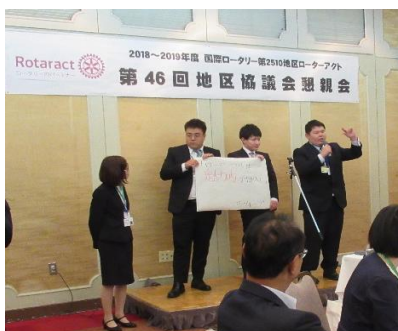
積極的に発表していた空蘭北RAC