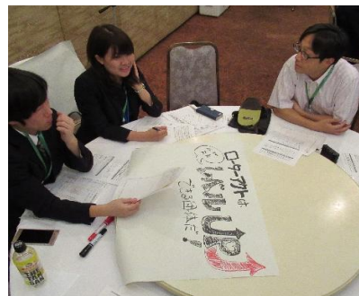
発表のために魅せる媒体作成