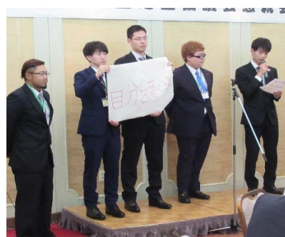
元気のよい発表と様々でした！