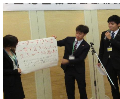
堂々たる発表でした