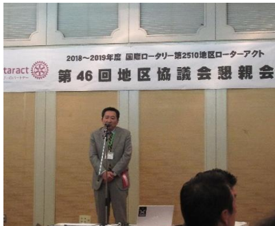
斎藤第9Gガバナー補佐による乾杯