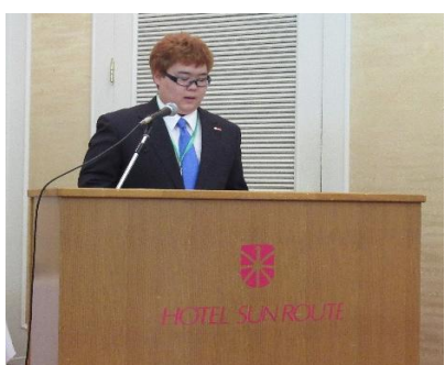
素晴らしい司会でした！