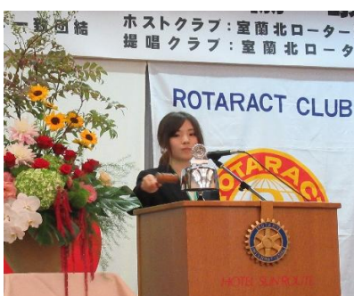
小野寺地区代表による点鐘