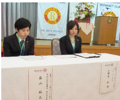
挨拶の準備も完璧です