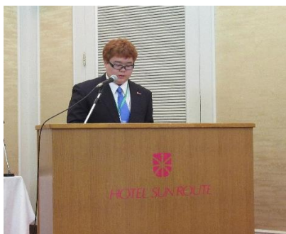
閉会式に引き続き素敵な司会

あっという間にメインプログラムが終了し、閉会式を迎えました。 室蘭北RACにとって久しぶりのホストを務めた行事ではありましたが、地区行事のホストを務めた経験は、今後のクラブ発展に大いに活かされるものとなります。いろいろと気づいたことや感じたこと、学んだことをぜひクラブに還元していただきたいと思います。 参加されたローターアクトも、本協議会で議論したことをこれからの活動に活かしていただきたいと思います。