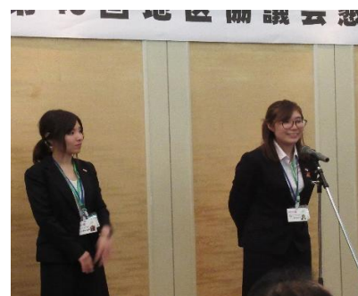
上浦地区代表ノミニー挨拶