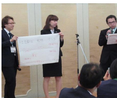
緊張している様子の発表や…