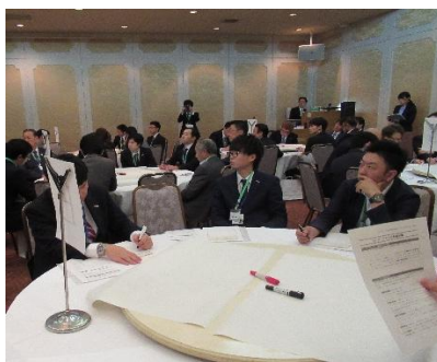
皆さん真剣に聞いています