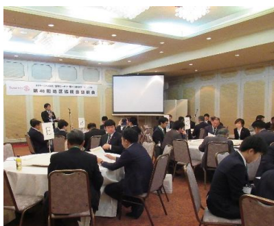
7つのグループに分かれました