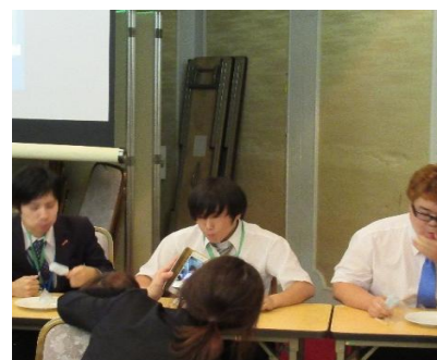
個人戦の様子…頭痛が…