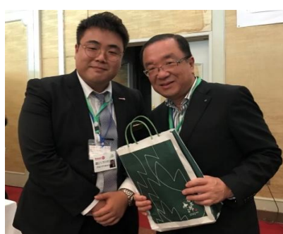
堀地区RA委員も参加しました