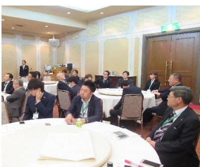
様々な案が出ています