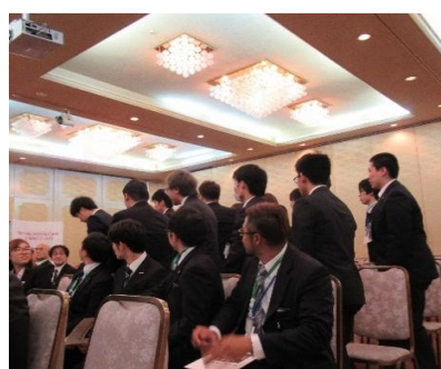
ホストを務める室蘭北RAC