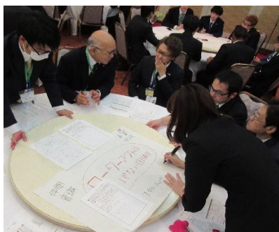
各グループ準備が終わりました