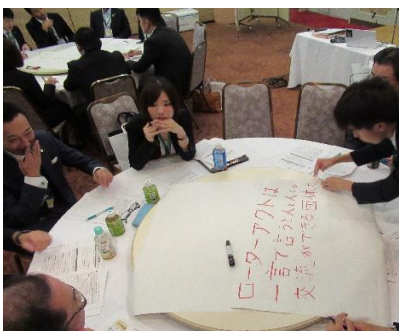
小野寺地区代表の熱意が伝わります