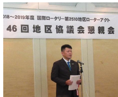
川下地区RA委員長による現状報告