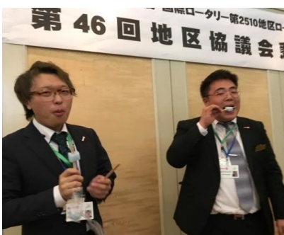
司会の2人も早食い！