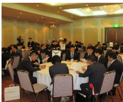
RC・RAC混ざったグループ