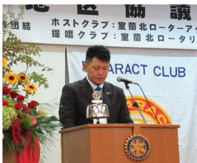
川下地区RA委員長のご講評