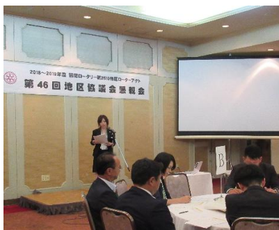
小野寺地区代表による現状報告