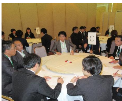
お互いの経験談も出し合いました