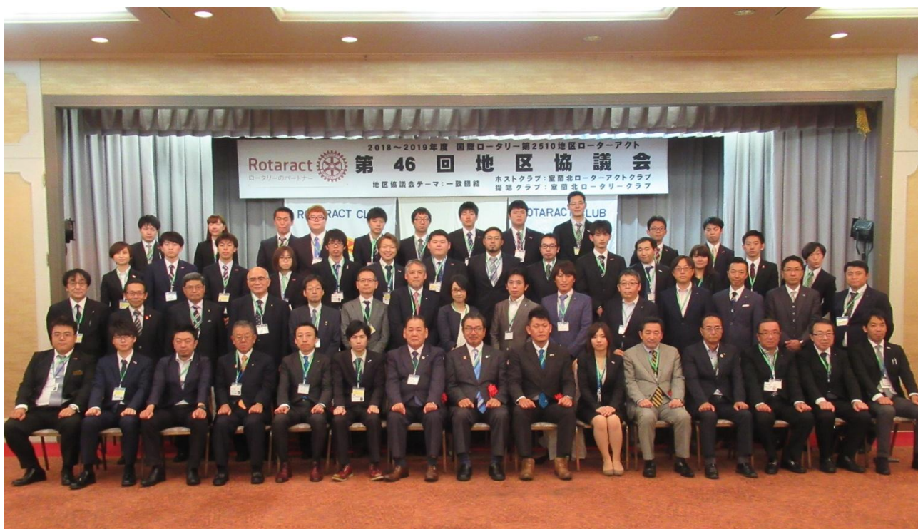
集合写真！沢山のご参加ありがとうございました！！