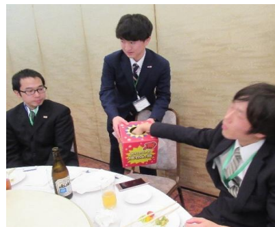
余興の代表者決めくじ引き…