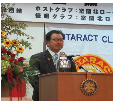
福田ガバナーエレクトのご挨拶