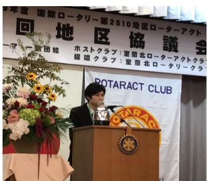
富山実行委員長の挨拶