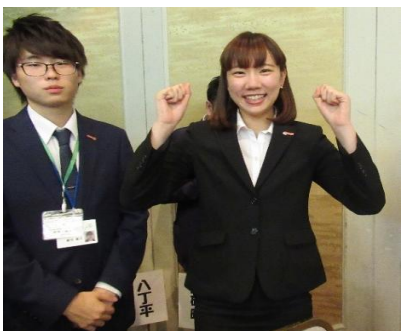
ガリガリくん食べます！