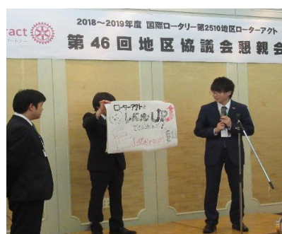
人前で発表する練習にもなります