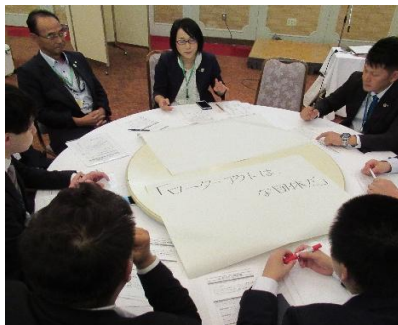
発表の最終確認中