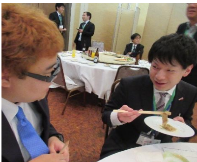
親睦を深めています