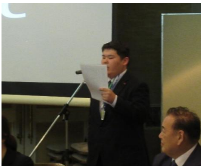
懇親会が始まります

余興では室蘭北RACの会員が企画したガリガリくん早食い競争を行いました。あまりの冷たさに皆頭を抱えながら一生懸命食べていました。その後の二次会也大いに盛り上がりました。