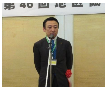
齋藤地区IA委員長の締めのご挨拶