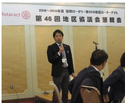
司会の石川地区幹事

ローターアクトのこれからについて様々な視点から考えることができ、充実した時間となりました。