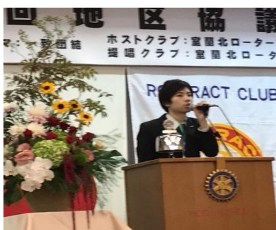
富山実行委員長の閉会の辞