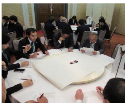
時間はあっという間に過ぎました