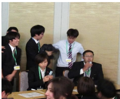
ガリガリくん早食い対決