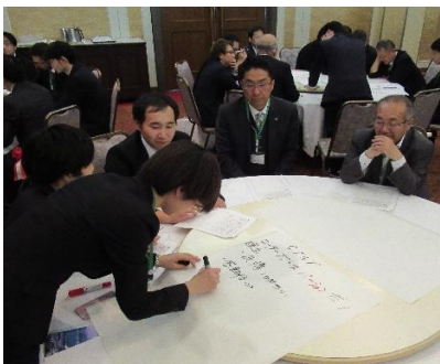
役割分担をし、発表準備

まだローターアクトに入会して間もないですが、精一杯地区代表就任に向けてたくさんの経験を積んでくれることを期待します。皆様のご支援とご協力をどうぞよろしくお願いいたします。