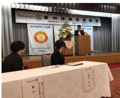
今後の活動に活かしましょう！