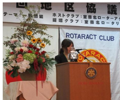
地区協議会を締めくくる点鐘