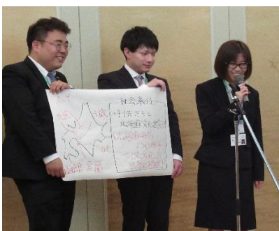
しっかりと考えを伝えています