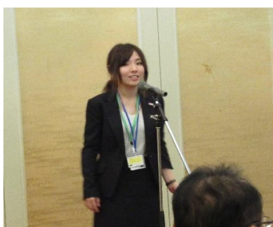
小野寺地区代表からノミニーの紹介