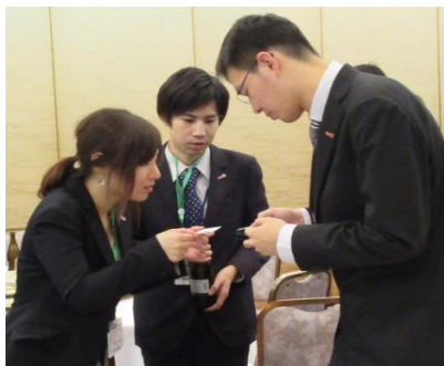
名刺交換で自己紹介