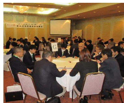
皆さんの熱い思いが聞けました