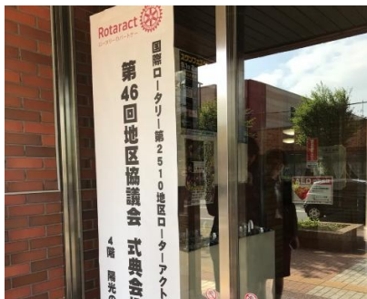
地区協議会ははじまります！

室蘭北RACがホストを務める第46回地区協議会が開催されました。室蘭北RACは入会して日の浅い会員が多く、準備や当日の運営を地区全体でサポートしましたが、ホストクラブの会員の努力のおかげで、無事に当日を迎えることができました。室蘭北RACの方々も初めてのことばかりで緊張する様子も見られましたが、慣れていくうちに参加者の皆様に対し、元気よく対応していました。