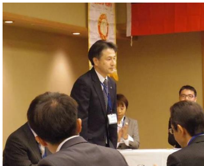
荒井地区幹事のご紹介