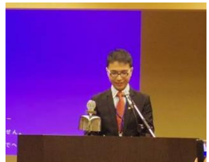
台湾からの参加者紹介