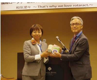
記念品の贈呈です