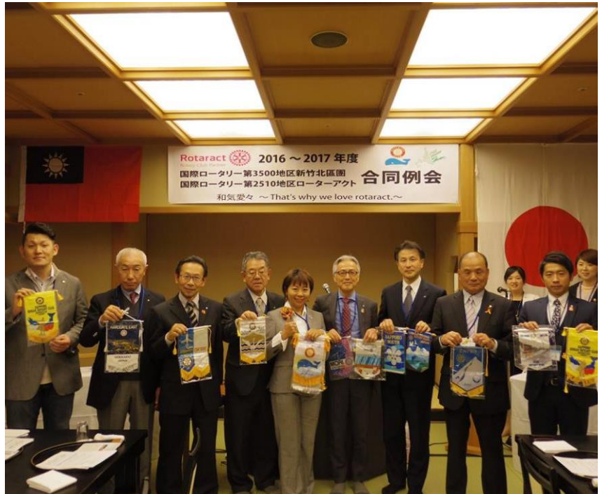
ロータリアンの皆様が交換したバナーとともに