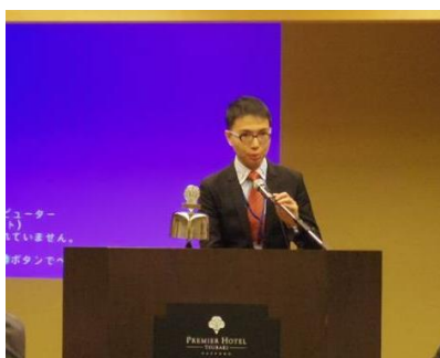
新竹北区RAC・Wewe会長ご挨拶