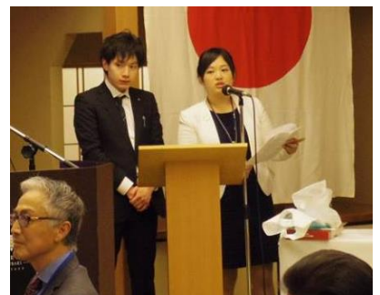
鈴江地区幹事と汪地区広報の司会