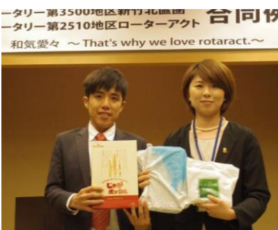
三浦地区代表歓迎の挨拶