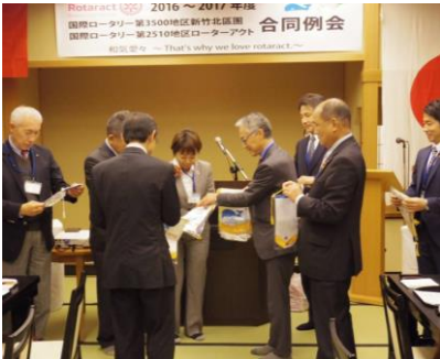
ロータリアン同士のバナー交換

日本語と中国語、そして英語を使って例会は進行され、いよいよお待ちかねの懇親会がスタートしました。昨年度から続いている交流がさらに深まり、話が尽きませんでした。海外の方々とこのように友情を深めることができるのもローターアクトの大きな魅力だと改めて感じました。