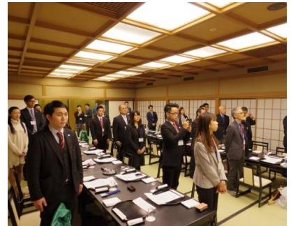
ロータークラブソング斉唱