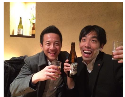
完全に出来上がってます…