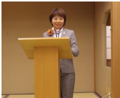
楊3500地区RA委員のご講評