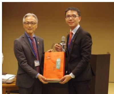
台湾のお土産もいただきました