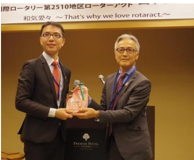
Wewe会長と石山地区RA委員長