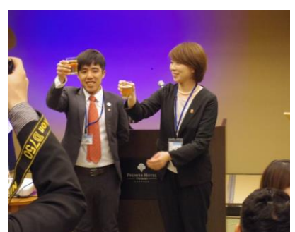
両地区代表による乾杯