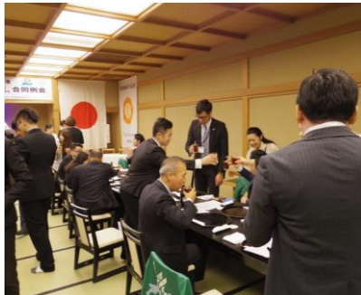
各テーブルで親睦を深めます