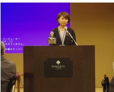
三浦地区代表歓迎の挨拶