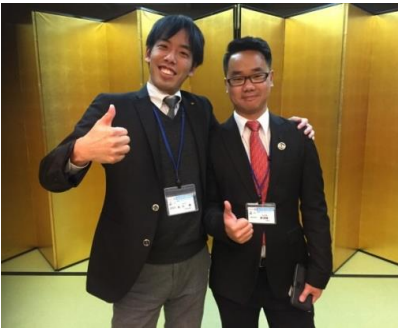
Leoとは7月以来の再会♪