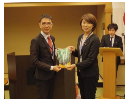
両地区代表同士で