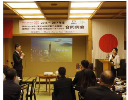
Wewe会長と汪地区広報