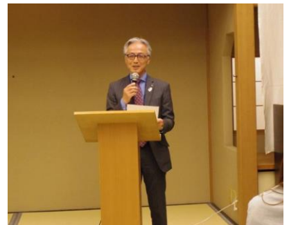
石山地区RA委員長のご講評