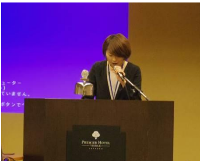
三浦地区代表による参加者紹介