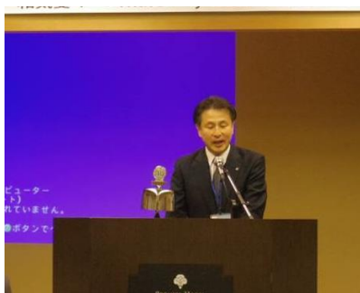
荒井地区幹事のご挨拶