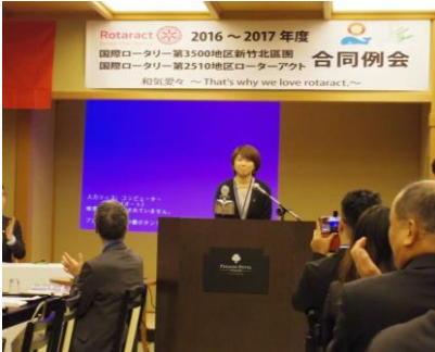
三浦地区代表の点鐘

海外のクラブとの合同例会は、当地区ではなかなかない行事ではありましたが、両地区の会員が有意義な時間を過ごせるよう、当日まで準備を進めてまいりました。例会前は再会を喜ぶ姿がたくさんありました。