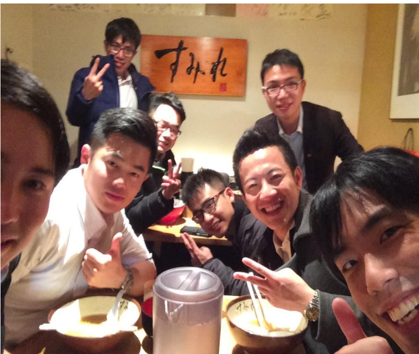
深夜3時…会話は尽きません！ラーメンもおいしかったです