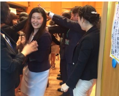
本当にお疲れ様でした☆