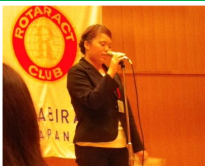
北村さん、本当にお疲れ様でした！