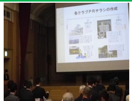
完成品はぜひホームページ等で！