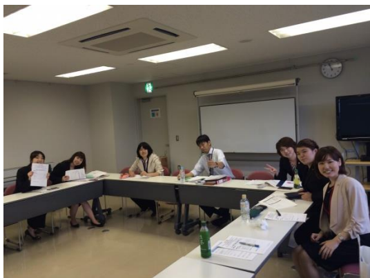
今年度地区役員…チームワーク抜群のメンバーです！

地区大会前に、第4回会長幹事会を行いました。全員で地区としての土台を築き上げることを最大のテーマとして、地区役員、各クラブ会長・幹事、そして地区RA委員の皆さまと一丸となって行動できたこと、そして地区の考え・思いを理解し、協力していただいたことに、改めて感謝申し上げます。 また、懇親会後の二次会も大変盛り上がり、親睦を深めることができました。