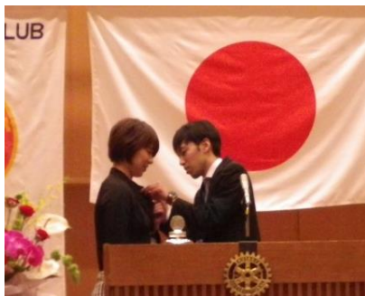
地区代表バッジ引継ぎ