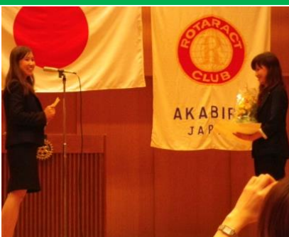
爽さんからの感動のお手紙