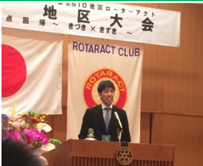
石川地区代表あいさつ