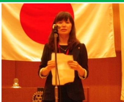
文さん、素敵な笑顔ありがとう☆