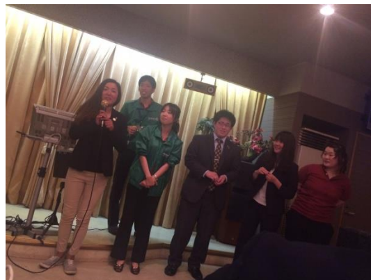
二次会恒例「100円ジャンケン」の勝者たち