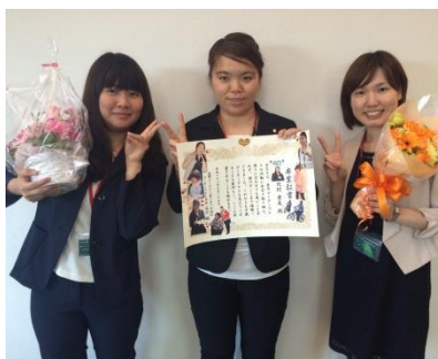
卒業証書と花束と一緒に…