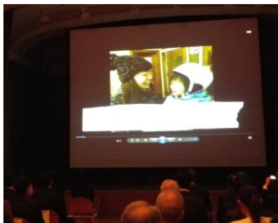
思い出のムービーを流しました