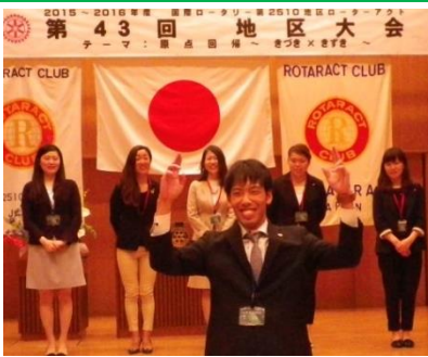
みんなで空も飛べるはずを合唱♪