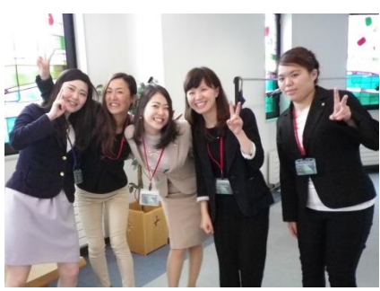
ご卒業おめでとうございます！