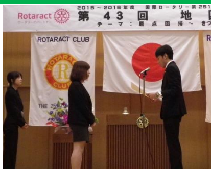
赤平 RAC の表彰