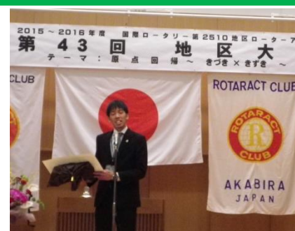
1年間代表お疲れさまでした！