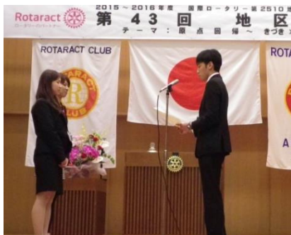
札幌幌南 RAC の表彰②