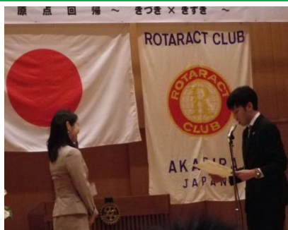
卒業証書授与のようす②