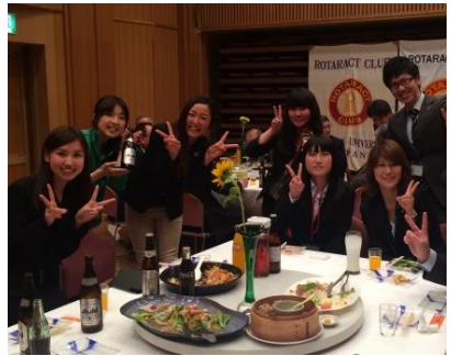
テーブルのようす③