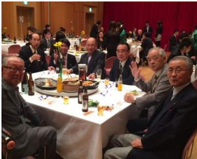
テーブルのようす①