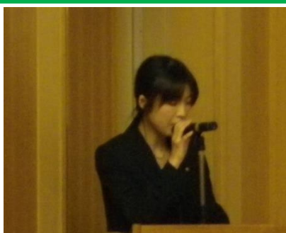
各クラブ PR チラシの紹介