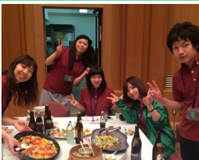
ホストの皆さんお疲れ様でした！