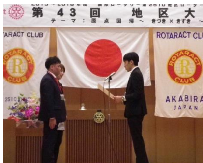
札幌幌南 RAC の表彰①