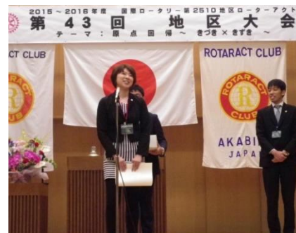
北海道交流会頑張りましたね！