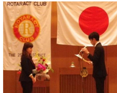
卒業証書授与のようす①