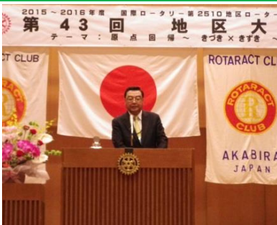
高江 RC 会長エレクトご挨拶