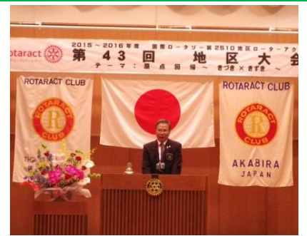
嵯峨ガバナーのご挨拶