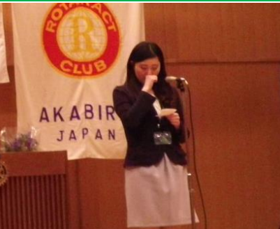
工藤さん、アクトを支えてくれてありがとう