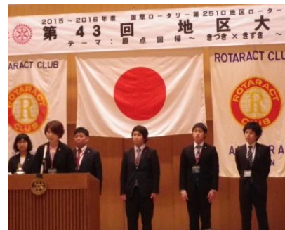
三浦次年度地区代表による決意表明