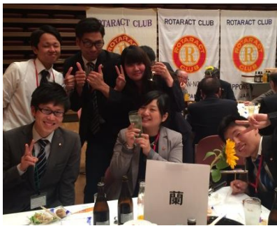
テーブルのようす②