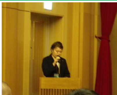
北村地区広報による活動報告