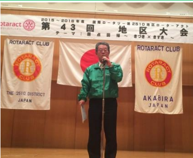
ユニフォームを着ていただきました