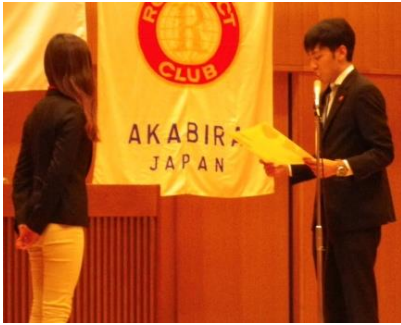
卒業証書授与のようす③