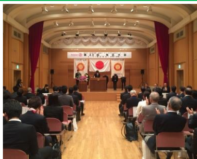
いよいよ次年度役員が動き出します