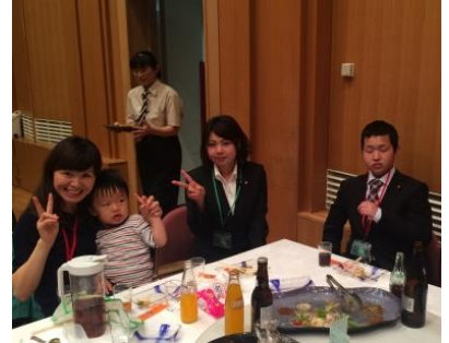
文さんのお子さんも一緒に♡