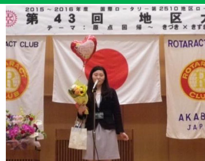
サプライズ発表でした☆