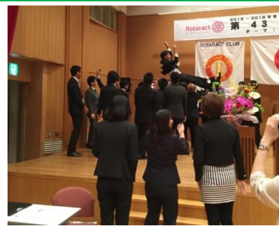
石川代表をサプライズで胴上げ！