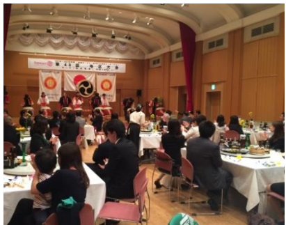
圧巻のパフォーマンスでした♪