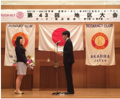
卒業証書授与のようす④