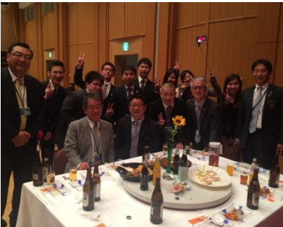
テーブルのようす④