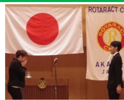
卒業証書授与の前に涙…