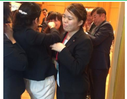
アーチを作って、卒業生を送り出します