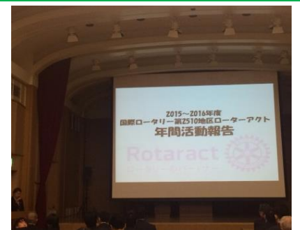
年間活動報告のようす